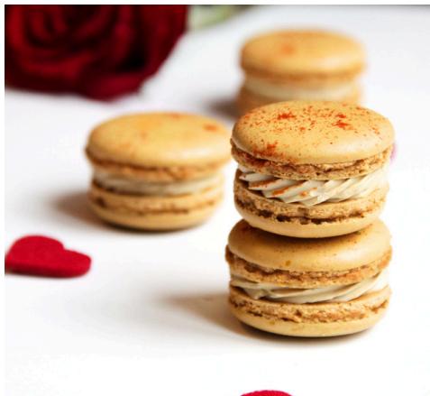
Macarons foie gras x4