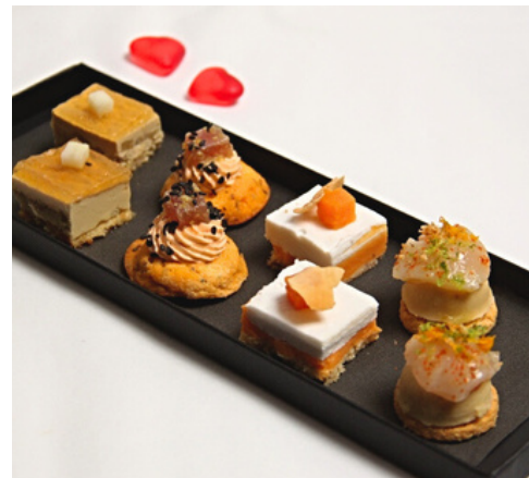
Pièces cocktail x8