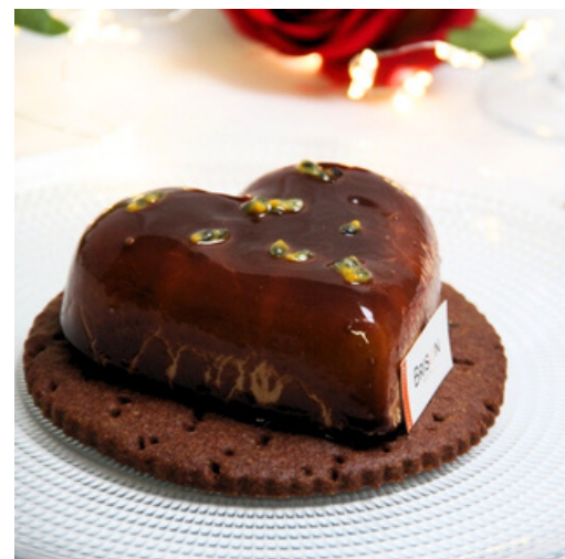
Coeur chocolat passion (pour 2)