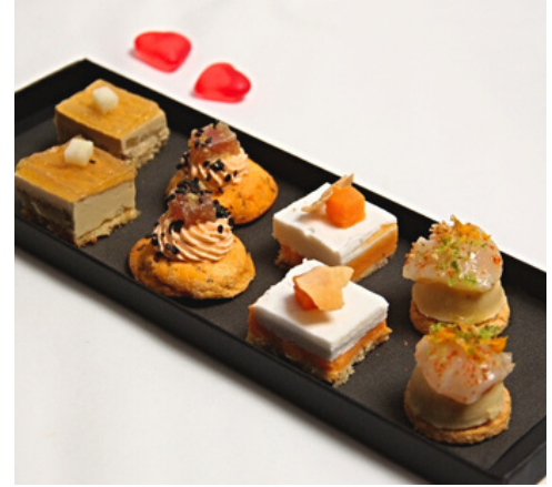
Pièces cocktail x8