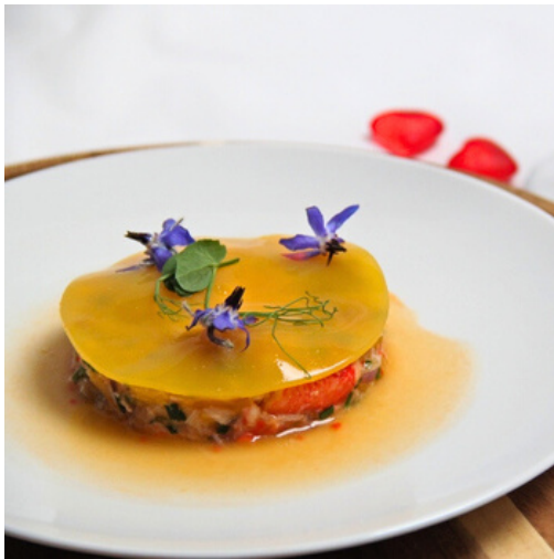
Homard passion, voile d'agrumes