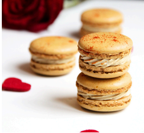
Macarons foie gras x4