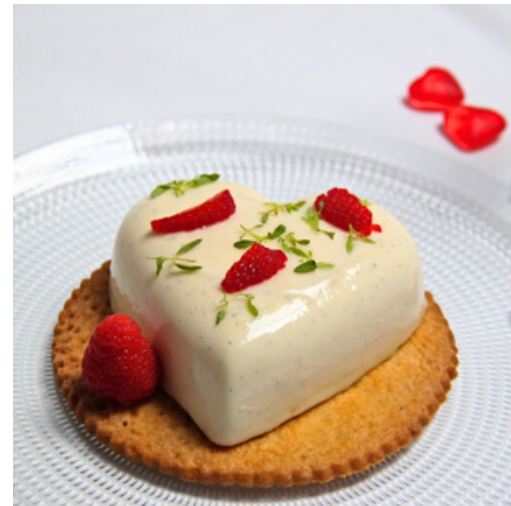
Coeur vanille, fambroise et citron (pour 2)