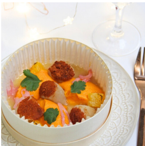
Noix de St Jacques tandoori, mousseline de carottes 🔥