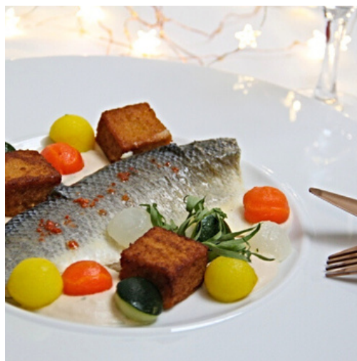
Filet de bar, beurre nantais à l'estragon, billes de légumes 🔥