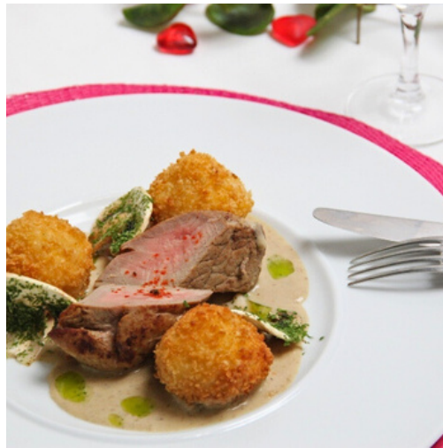
Quasi de veau, sauce aux cèpes, arancini mozzarella & cèpes 🔥